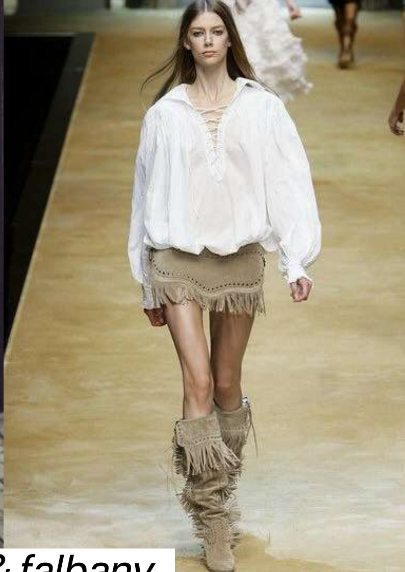
frędzle & falbany