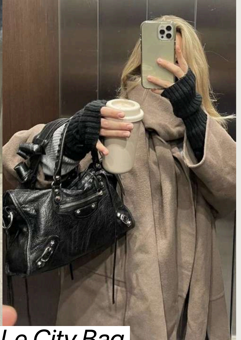
Balenciaga Le City Bag