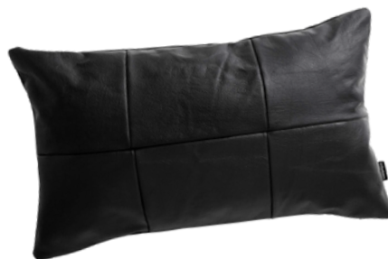
PODUSZKOWCY 99 PLN