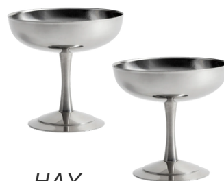
HAY 95 PLN