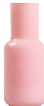
HOMLA 20 PLN