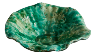
ZARA HOME 169 PLN