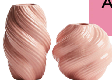
H&M 349,99 PLN