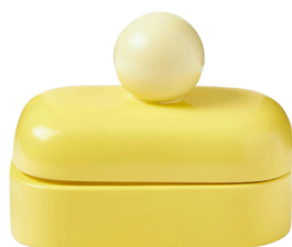
WESTWING 99.90 PLN