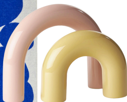
WESTWING 189.90 PLN