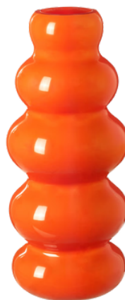
IKEA 39.99 PLN