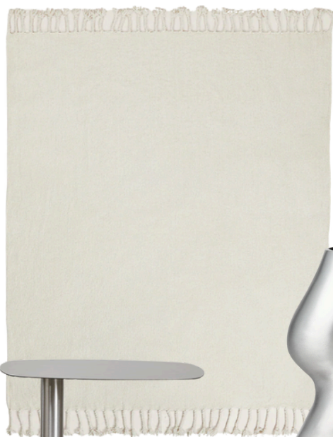
ZARA HOME 149 PLN