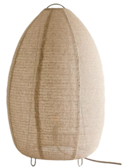
ZARA HOME 299 PLN