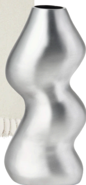
WESTWING 269.90 PLN