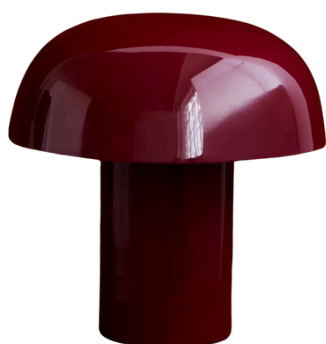
H&M 164,99 PLN