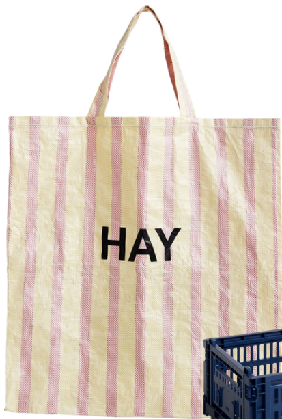
HAY 56 PLN