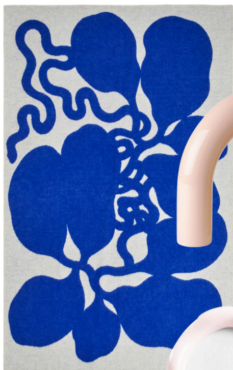
ARKET 390 PLN