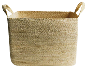
ZARA HOME 149 PLN