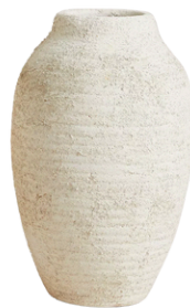
ZARA HOME 149 PLN