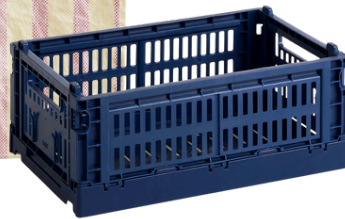
HAY 18 PLN