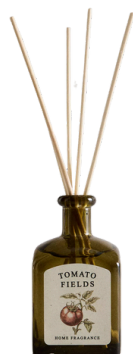
ZARA HOME 139 PLN