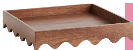
H&M 74,99 PLN