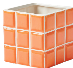
WESTWING 84.90 PLN