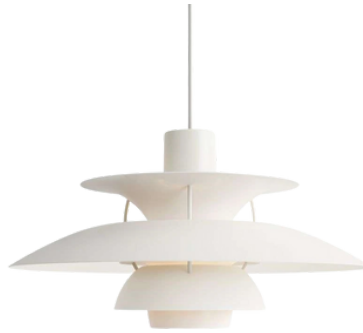
LOUIS POULSEN ok. 3000 PLN