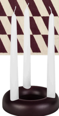
NOO.MA 151 PLN