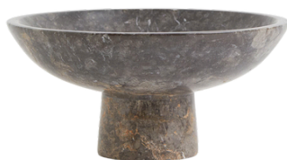
H&M 189.99 PLN