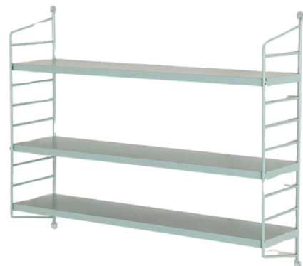
SKLUM 129.95 PLN