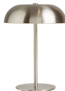
ZARA HOME 149 PLN