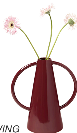
WESTWING 179,90 PLN