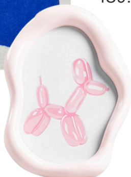
HOMLA 35 PLN