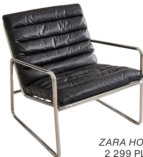
ZARA HOME 2 299 PLN